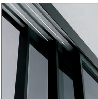
Sistemi scorrevoli. Sliding systems.

TELAIO in alluminio estruso in lega 6060 "Cover Frame System" supportato in PVC pluri-camere.